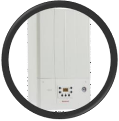
Victrix Tera 28 24.000