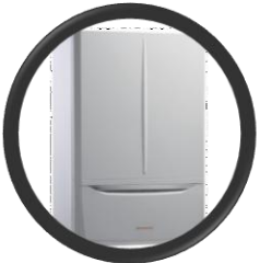
Immergas Victrix Exa 28 ERP