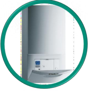
EcoTEC PLUS VUW 236/5-5 17.000 kcal/h