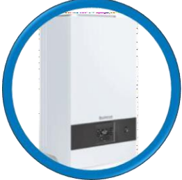
Logamax Plus GB-022i-20 KD H 17.200 kcal/h