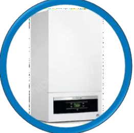
GB-062-24KD HV2 20.726 kcal/h