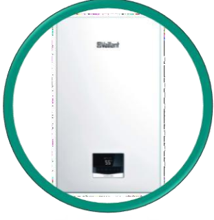
EcoTEC INTRO 18-24 TAM YOĞUŞMALI