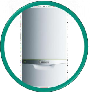
Green IQ EcoTEC VUW 356/5-7 25 Kw 20.000 kcal/h