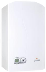
DIVACONDENS D PLUS F24 24 KW YARI YOĞUŞMALI