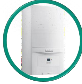
EcoTEC Pure VUW 236/7-2 17.372 kcal/h