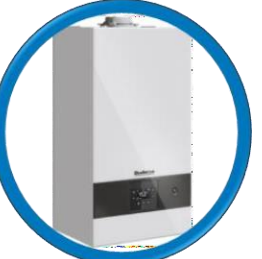
Logamax Plus GB-122i-24 KD H-ERP 20.726 kcal/h