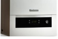
Buderus Logamax Plus GB012-25KW