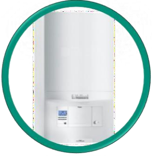
EcoTEC PRO VUW 236/5-3 17.000