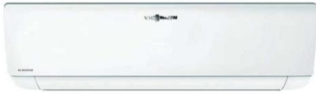
VISSMANN VİTOCLİMA 200-S/HE W2035MDH1 12.000 DYNAMIC