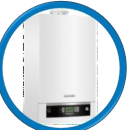
Logamax Plus GB072-24K V2 24 kw 20.000 kcal/h