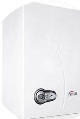
BLUEHELIX TECH 25C 26,5KW TAM YOĞUŞMALI