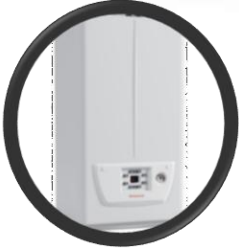
Victrix Omnia 25 17.888 kcal/h