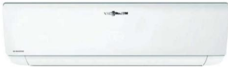
VISSMANN VİTOCLİMA 200-S/HE WS2046MLC0 16.000 ECO